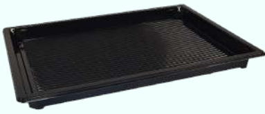
Sushi-tray 255x185mm "Zwart"