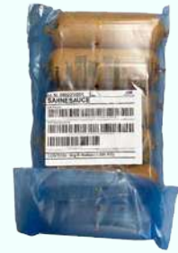
SCHEID sahneseauce 500GR A06241