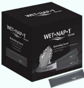
Verfrissingsdoekjes WET-NAP 1 (18x28cm)