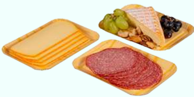
Kartonnen schaal met houtprint