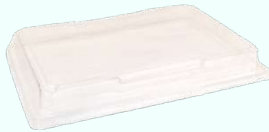
Deksel Sushi-tray 255x185mm "Transparant"