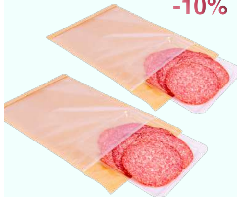
Gelamineerde papier/PP enveloppe