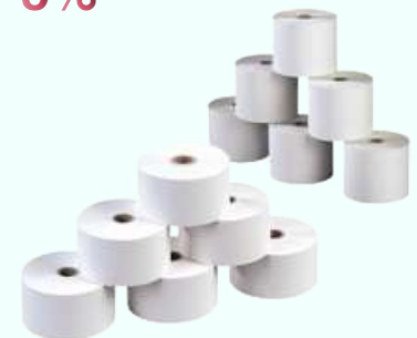
Kassarollen Thermo Verschillende afmetingen. Vraag meer info bij uw vertegenwoordiger!