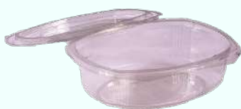
Salade container 250ml met scharnierdeksel "Transparant" A07468