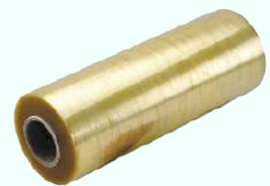
Ultimate SMM20 1500m

Verkrijgbaar in verschillende afmetingen.