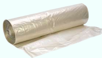
Vuilniszak op rol 90x120 LDPE 50my "Transparant" A15177