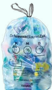
PMD zakken op rol 120L "Blauw"